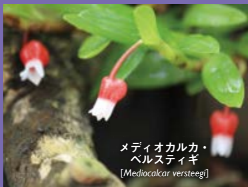
メディオカルカ・ベルスティギ [Mediocalcar versteegii]

ツートンカラーで1cm足らずの愛らしい壺型の花。この仲間メディオカルカはニューギニア、インドネシア東部などの高地に自生する着生ランで、現地では約20種見られます。当館のように夏を涼しく保つと何ヶ月も花が咲き続けます。