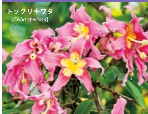
トックリキワタ [Ceiba speciosa]

コノフィツム（属）は南アフリカ、ナミビアに分布する多肉質の植物です。10月～11月に黄、ピンク、朱、白などの花を魅力的に開花させます。