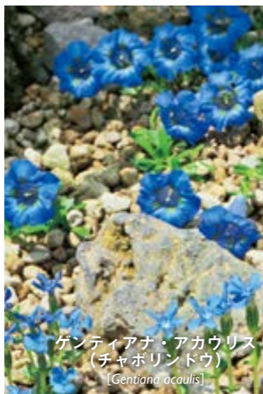
ゲンティアナ・アカウリス （チャボリンドウ） [Gentiana acaulis]

平地では春咲きリンドウですが、ヨーロッパアルプスの3000mの高山では夏の花になります。当館では8月に咲きます。その花の姿から「茎（花茎）のないリンドウ」の意味を学名にもちます。なお、写真手前の小型のリンドウはゲンティアナ・ベルナ（Gentiana verna）です。