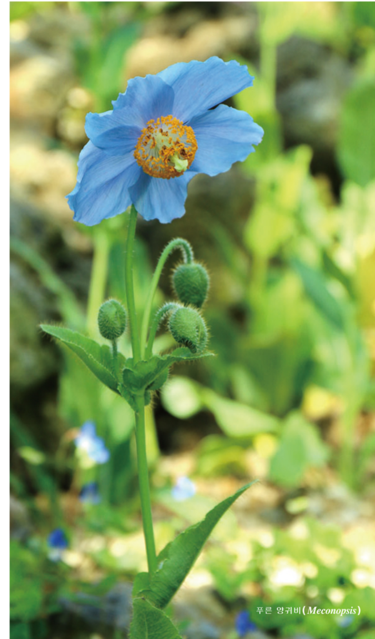
푸른 양귀비 (Meconopsis)