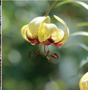
Lilium Primulinum var. Burmanicum

터키에서 촬영한 사진. 코움은 튼튼한 시클라멘 야생종으로, 더위와 추위(-20℃ 까지)에 강합니다. 시클라멘 야생종에는 대략 20종류가 있으며, 시클라멘 코움의 개화 시기는 1~3월입니다. 저희 식물원의 코움에서도 씨앗이 나오기에, 이런 어린 모종을 키우는 장소도 있습니다.