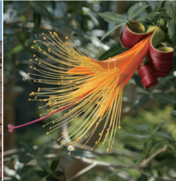
Adansonia fony(=A. rubrostipa)

아프리카 나미브 사막에서 촬영한 사진. 웰위치아는 겉씨식물이며 자웅이주입니다. 현지에는 수령이 2,000년인 웰위치아도 있다고 합니다. 장수하는 식물 대다수는 건조, 한랭 등 척박한 땅에서 발견됩니다. 저희 식물원의 웰위치아는 1960년경 심은 실생묘로, 세계 식물원에서도 최대급 크기를 자랑합니다.