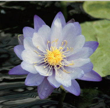
Nymphaea Gigantea 기장리야 수련

열대 수련은 인도, 아프리카 외에도 재래종처럼 오스트레일리아에도 분포해 있습니다. 저희 식물원에는 다양한 종류의 열대 수련이 전시되어 있으며 사계절 내내 꽃을 피웁니다.