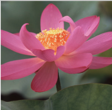
Nelumbo Nucifera (From Australia) 연꽃(오스트레일리아산)

열대 수련은 인도, 아프리카 외에도 재래종처럼 오스트레일리아에도 분포해 있습니다. 저희 식물원에는 다양한 종류의 열대 수련이 전시되어 있으며 사계절 내내 꽃을 피웁니다.