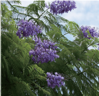
Jacaranda Mimosifolia 자카란다

쓰촨성이 원산지인 낙엽수, 록 가든 입구 에 높이 6m의 손수전나무가 있으며, 4월 말부터 5월 초쯤에 꽃이 피어 절정을 이룬 니다. 이외에도 산야초를 즐길 수 있습니다.