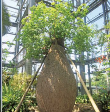
Ceiba Insignis 원명주송나무

하와이 카우아이 섬에서 촬영한 사진. 현지에서는 코키오 케오케오( Kokio Keokeo )라 불리며 절멸 위기종입니다. 저희 식물원에서는 하와이, 레위니옹 등 야생종과 원예품종 50종 이상을 히비스커스 월드에서 보실 수 있습니다.