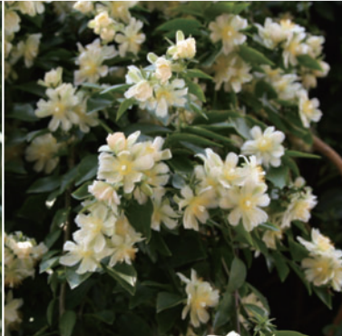
Pereskia Aculeate 목기린

루브로스티파 마오바브나무(포니 마오바브) 마다가스카르 원산, 8월 초순 19시 이후 약 30분 동안 막대기 모양의 꽃봉오리가 개화합니다.