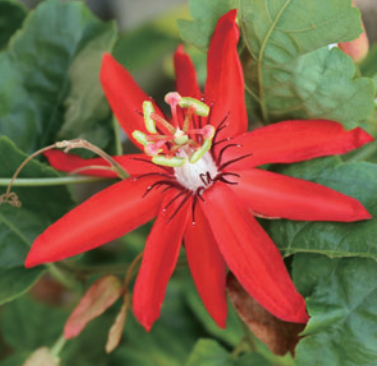
Passiflora Coccinea 홍화시계초

시계꽃과에 속하며 볼리비아와 베네수엘 라에 분포해 있습니다. 빨간 꽃을 좋아하는 벌새를 통해 타가루분이 이루어집니다. 개화 시기는 12월입니다.