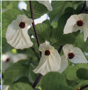
Davidia Involucrata 손수전나무

흔히 잉글리시 가든에는 200종류나 되는 한해살이풀, 두해살이풀, 여러해살이풀 등이 군생하고 있으며, 색채 계획으로 식물을 색깔별로 재배하고 있습니다. 초목이 펼쳐지는 가운데, 멋진 경치를 보실 수 있습니다. 봄~가을마다 피어나는 꽃을 즐길 수 있습니다.