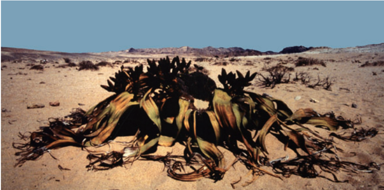
Welwitschia Mirabilis (Sabakuomoto/ Desert Rohdea Japonica as Japanese name) 웰위치아(일본명 사막만년청물)

북미 남부~남미에 분포하는 돌나물과 식물입니다. 매혹적인 밤이라는 통칭처럼 아름다운 꽃이 피어납니다. 개화 시기는 봄~가을입니다.