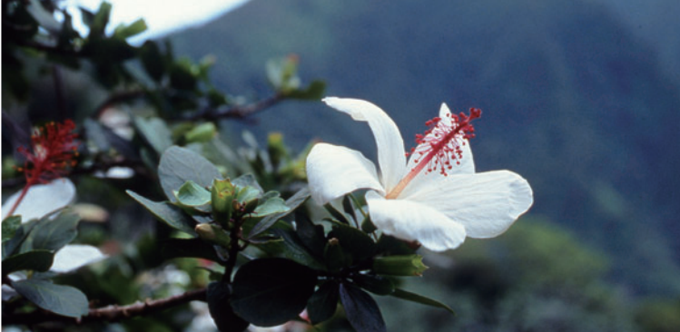
Hibiscus Waimeae 히비스커스 와임에

말레이 반도 원산. 껍질바삭과 과일나무이며, 생으로 먹거나 파이 등에 넣어 만들어 먹습니다. 부정기적으로 열매가 맺힙니다.