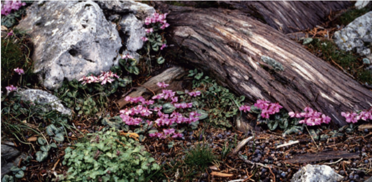
Cyclamen Coum 시클라멘 코움

푸른 양귀비와 같은 양귀비과에 속하며 히말라야~쓰촨성의 해발 3,500m 이상 지역에 분포해 있습니다. 개화 조절을 통해 사계절 내내 볼 수 있습니다.