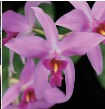
Laelia Anceps 렐리아 안셀스

아마존 하류 지역의 습지에서 촬영한 사진. 세계 최대급 이파리를 가진 수련으로, 달콤한 향기가 감도는 하얀 꽃은 저녁 무렵부터 피어납니다. 부력이 있어, 몸무게가 가벼운 사람이라면 이파리 위에 탈 수 있습니다. 사계절 내내 꽃을 피웁니다. 저희 식물원에서는 다양한 수초를 보고 즐길 수 있습니다.