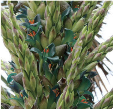
Puya Alpestris 푸야 알페스트리스

남아시아 원산으로 봄에 개화하며, 여름에 열매를 맺습니다. 유익한 식물 광장에는 과일나무와 야채가 전시되어 있습니다.