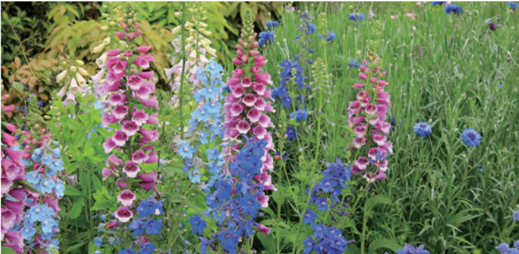
Delphinium, Digitalis 델피니움, 디지털리스

칠레의 안데스 산맥이 원산인 식물입니다. 보기 드문 밝은 비취색 꽃이 피어납니다. 내한성이 있는 건조지 식물은 데저트 가든에 있습니다.