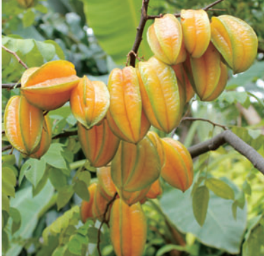
Averrhoa Carambola (Star fruit) 카람볼라(스타프루트)

시계꽃과에 속하며 볼리비아와 베네수엘 라에 분포해 있습니다. 빨간 꽃을 좋아하는 벌새를 통해 타가루분이 이루어집니다. 개화 시기는 12월입니다.