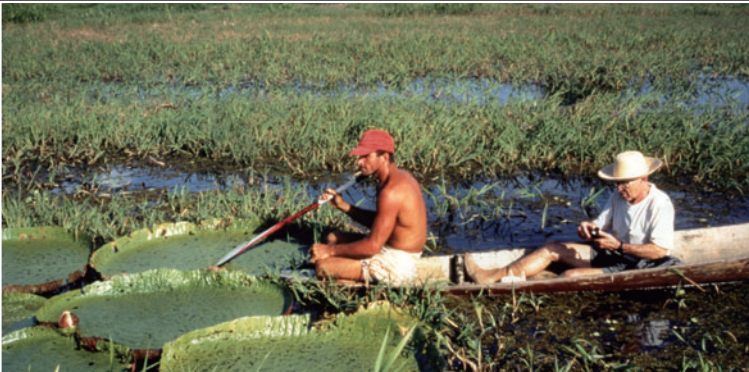
Victoria Amazonica 큰가시연꽃

중국, 인도, 일본 이외 오스트레일리아 등에도 분포하며, 개화 시기인 여름에는 다양한 품종의 연꽃을 전시합니다.