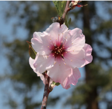
Prunus Dulcis 아몬드

남아시아 원산으로 봄에 개화하며, 여름에 열매를 맺습니다. 유익한 식물 광장에는 과일나무와 야채가 전시되어 있습니다.