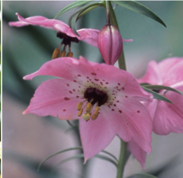
Nomocharis Aperta (=Forrestii)

릴리움 프리물리눔 버마니쿰 백합과에 속하며 네팔나리( Lilium nepa- lense )와 유사하나, 작은 여러 개의 꽃이 피는 게 특징이며 7월에 개화합니다.