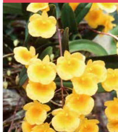
デンドロビウム・リンドレイ [ Dendrobium lindleyi ]

白くて細かい産毛のようなトゲが雪のように見えます。花は鮮やかな赤でトゲの白とコントラストが美しく、3月に咲きます。