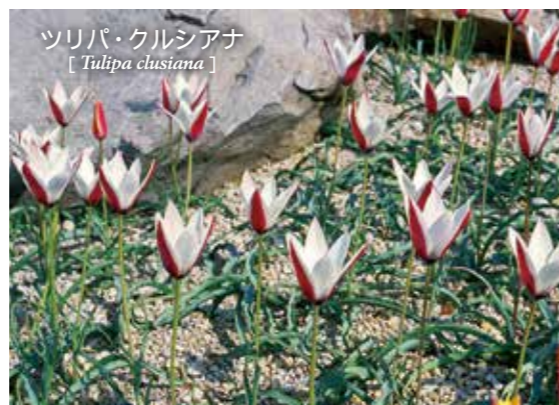
ツリバ・クルシアナ [ Tulipa clusiana ]

イラン~カシミールにかけて分布、上品な姿から英名では Lady Tulip と呼ばれ 3 ~ 4月に咲きます。