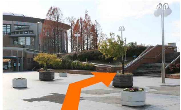
② さらに右手にある階段を上ります