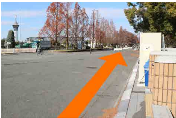
③ 右に曲がり、花博通りに向かって直進します