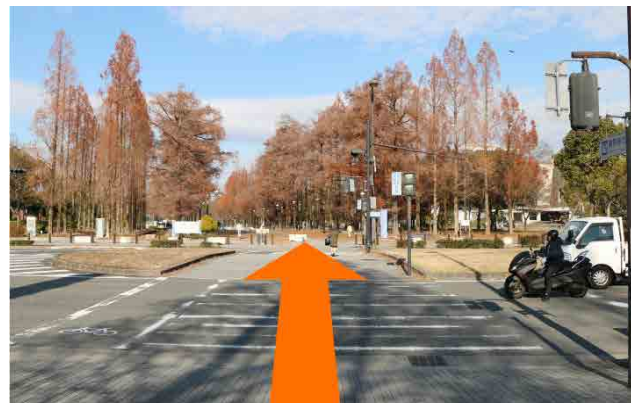
④ 横断歩道を渡り直進すると、鶴見緑地公園に入ります