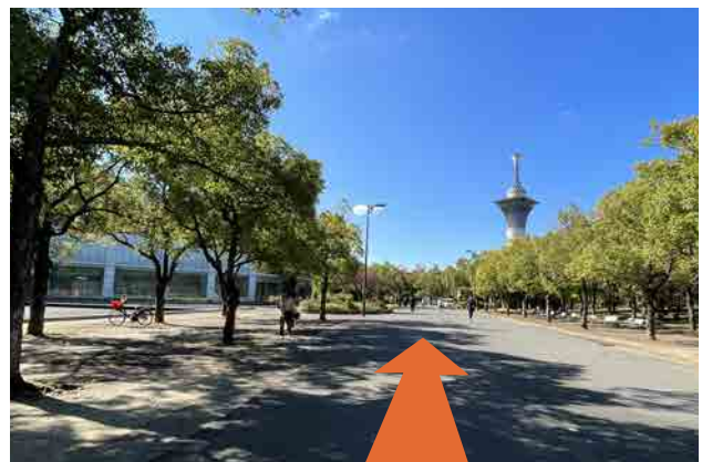
⑥ 大きい並木通りを道なりに歩きます ※左手のガラスの建物はハナミズキホール