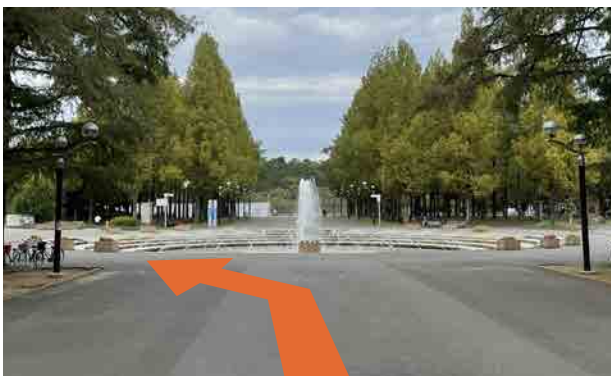
⑤ 並木道を直進し、正面に噴水場が見えてきますので、左に曲がります