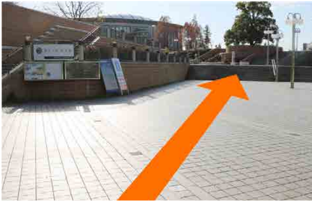
① 改札から出て正面右手にある階段を上ります