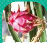
ドラゴンフルーツ